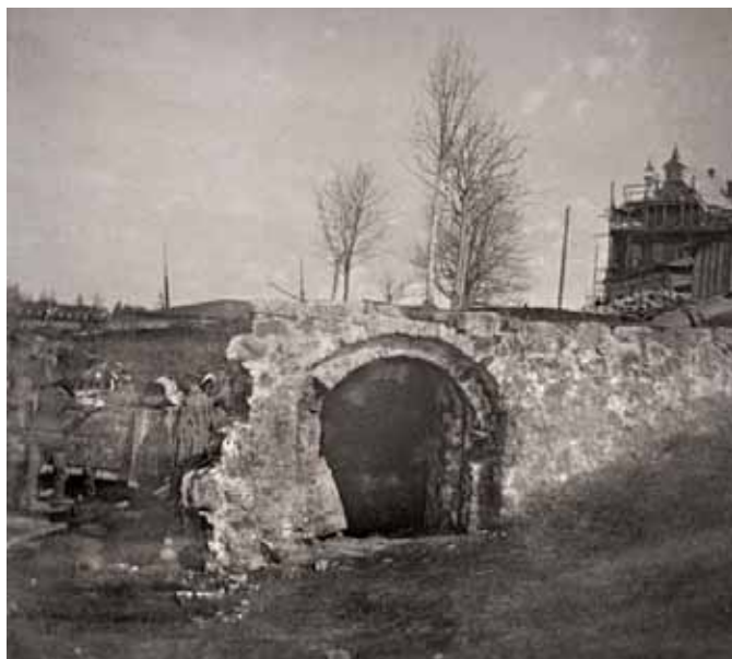
Илл. 2. «Государевы» ворота в 1890-е гг. Lappeenranta museot

возведена» 20 . Это чуть ли не самое раннее в истории Выборга упоминание об опыте охраны памятников старины. Так или иначе, но акционеры получили столь желанное согласование от командира Финляндского инженерного округа, но место стройки было перенесено подальше от ворот. Руины нижнего яруса средневековой башни «Хокана» с мемориальными «Государевыми» воротами сохранялись вплоть до нач. XX в. (илл. 2), пока не были засыпаны трассой улицы Южный вал 21 .