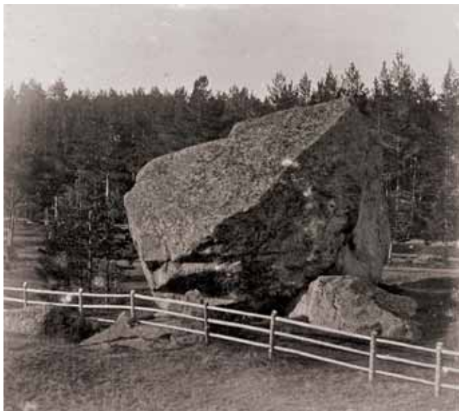
Илл. 3. Казак-камень в 1890-е гг.

Записки путешественников содержат на первый взгляд необычный сюжет, связанный с празднованием Иванова дня или Юханнуса. Каждый год, в самую длинную ночь, местные крестьяне вкатывали на выборгский «казак-камень» смоляную бочку и поджигали её, а также раскладывали костры вокруг валуна. Встречаются свидетельства, что следы смолы и костров на вершине камня были заметны вплоть до конца XIX в. (илл. 3) 34 . Зафиксированный обряд был характерен для местного населения 35 .