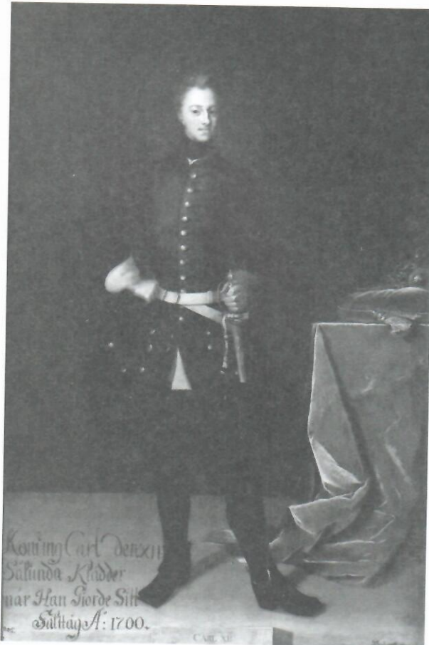
David von Krafft. 1655–1724. Ruotsin kuningas Kaarle XII. Kangas, öljy.

vuosina 1702–1707. Niitä olivat Pietarin tehdas Lohijoen suistossa nykyisen Petroskoin alueella sekä Poventsan, Aleksejevskin ja Kentjärven sulatto. Kentjärvellä sulatettiin sekä rautaa, että kuparia.